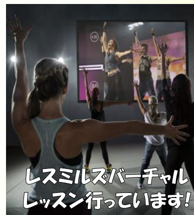
レスミルズバーチャル レッスン行っています!